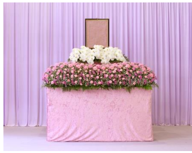
花祭壇 A タイプの場合 754,700 円 税別