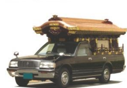
霊柩車・マイクロバス