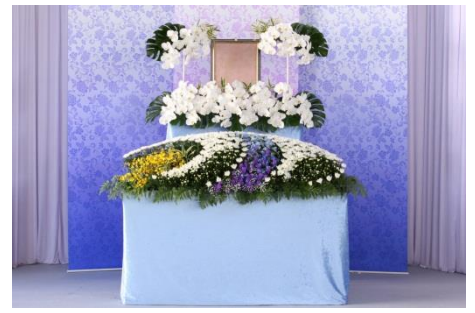
花祭壇 B タイプの場合 784,700 円 税別

各祭壇プランに下記項目が共通して含まれます。人数の超過が無ければ追加料金はありません。