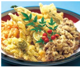
寿司・揚げ物・煮物・香の物