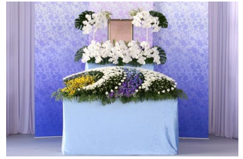
花祭壇 Bタイプの場合 775,000 円 税別

各祭壇に下記項目が共通して含まれます。人数の超過が無ければ追加料金はありません。