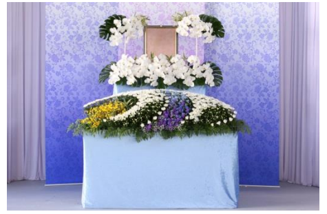
花祭壇 Bタイプの場合 882,400円 税別

各祭壇に下記項目が共通して含まれます。人数の超過が無ければ追加料金はありません。