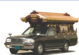
霊柩車 有・バス 無