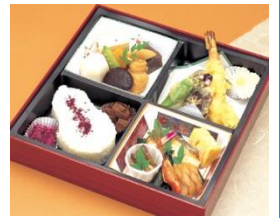
通夜料理 50名様対応分 寿司・揚げ物・煮物・香の物 ※握り寿司のプランもあります 告別式お膳 20名