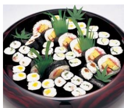
通夜料理 25 名様対応分

各祭壇に下記項目が共通して含まれます。人数の超過が無ければ追加料金はありません。