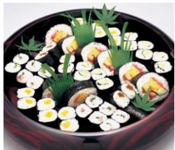
通夜料理 100名 様対応分

各祭壇に下記項目が共通して含まれます。人数の超過が無ければ追加料金はありません。