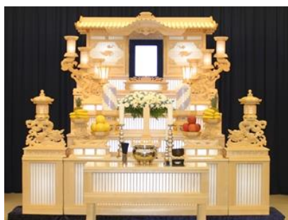
白木五段祭壇の場合 581,600円 税別