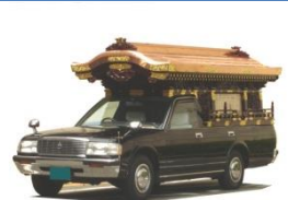
霊柩車 有・バス 無