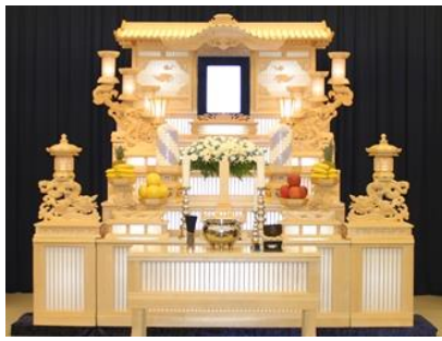
白木五段祭壇の場合 862,100円 税別