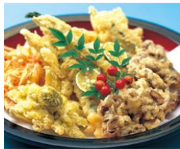
寿司・揚げ物・煮物・香の物