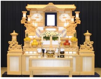
白木五段祭壇の場合 534,700円 税別