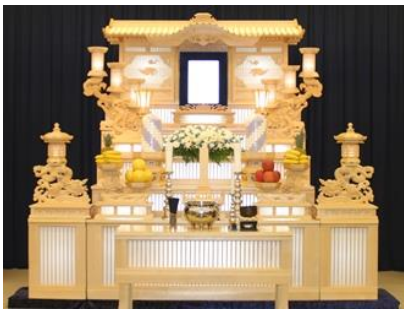
白木五段祭壇の場合 688,700円 税別